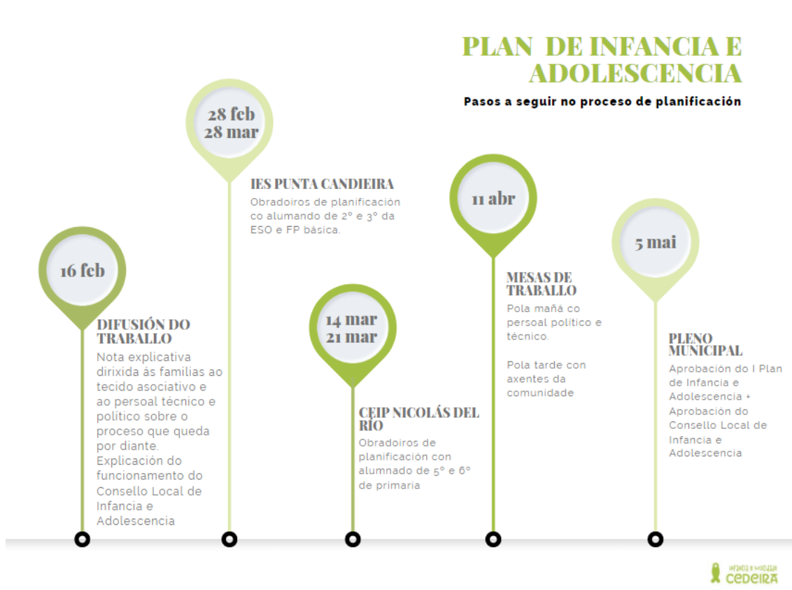
Figura nº2. Calendario de traballo do I Plan de Infancia e Adolescencia (2023 – 2028)

O traballo de planificación levouse a cabo entre os meses de xaneiro e maio de 2023, partindo da cooperación e colaboración con diferentes áreas técnicas municipais e tomando en conta o traballo no marco dos orzamentos participativos desta anualidade. O obxectivo era dobre, por unha banda, preparar para á comunidade cedeiresa para a realización de achegas nesta fase de planificación, con especial protagonismo da poboación máis miúda; e por outra banda, informar á rapazada, ás familias e á comunidade educativa, de forma fundamental, sobre o futuro Consello Local de Infancia e Adolescencia . As ideas concretáronse nun calendario de traballo recollido de forma breve na Figura nº 2.