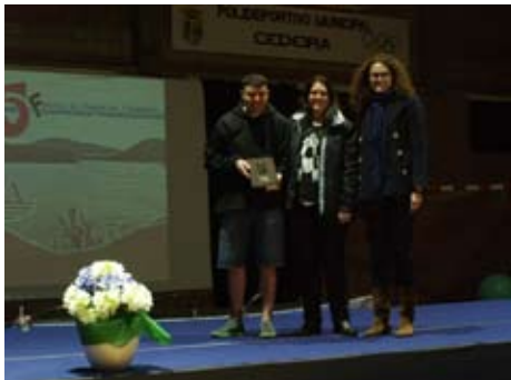
Mención Especial: aos 20 anos do Club Deportivo Apader,