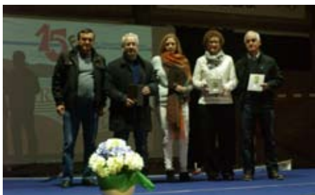
Mención Especial: aos veteráns de bádminton polo seu bo facer no Campionato de España