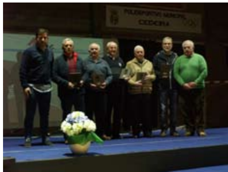
Mención Especial: os 50 anos da primeira medalla nacional de remo